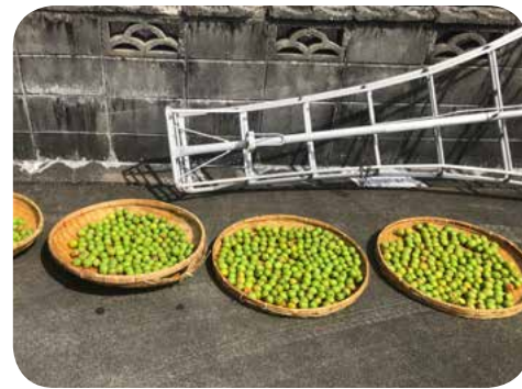
今年は梅がたくさん収穫できました。軽く洗って、少し乾かせてから梅干しにします。