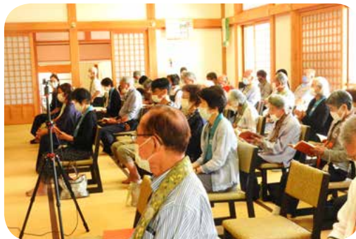
永代経は、youtube で生配信を行いました。今からでも永代経の様子をご覧になれます。