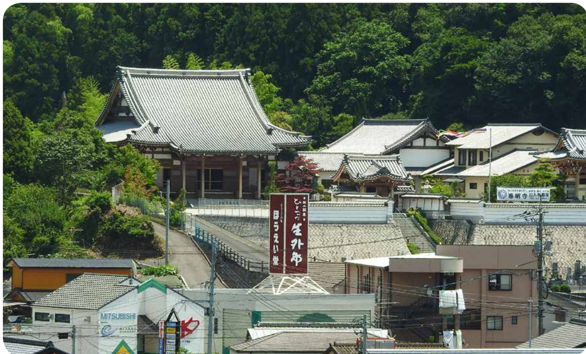
サンリブの屋上から見える専明寺の風景