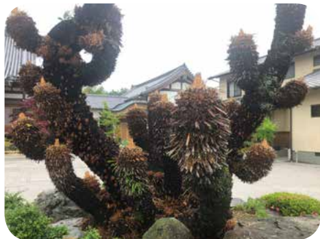
本堂前のソテツをご門徒さんと一緒に剪定を行いました。