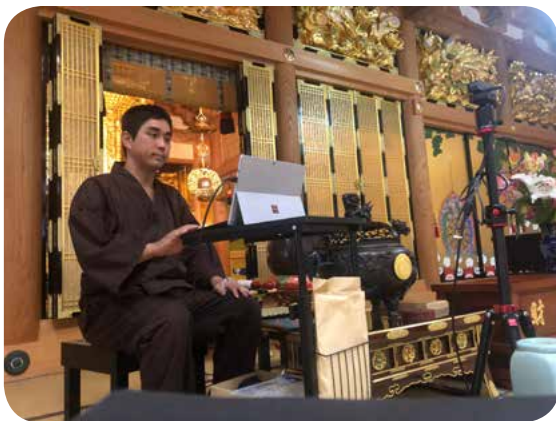
事前の動作確認の様子

お近くの方はお寺に集まって頂き、遠方の方はパソコンかスマートフォンがあれば法事に参加できます。これからは移動の交通費と時間を節約しても法事には参加できますので、どうぞ専明寺までご相談ください。また若い方にも法事へのご参加をお勧め頂ければと思います。