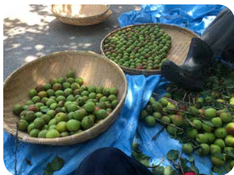
梅をザルに取り分けていきます。ブルーシートいっぱい収穫できました。